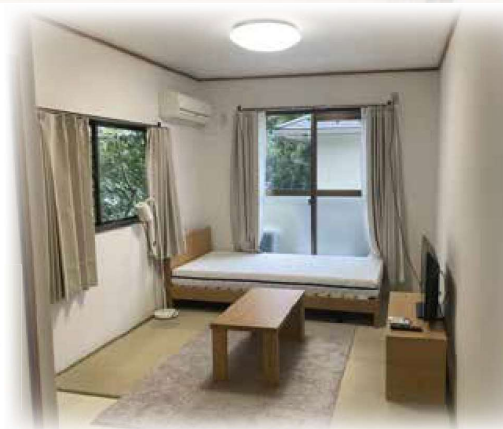
※室内写真はイメージです